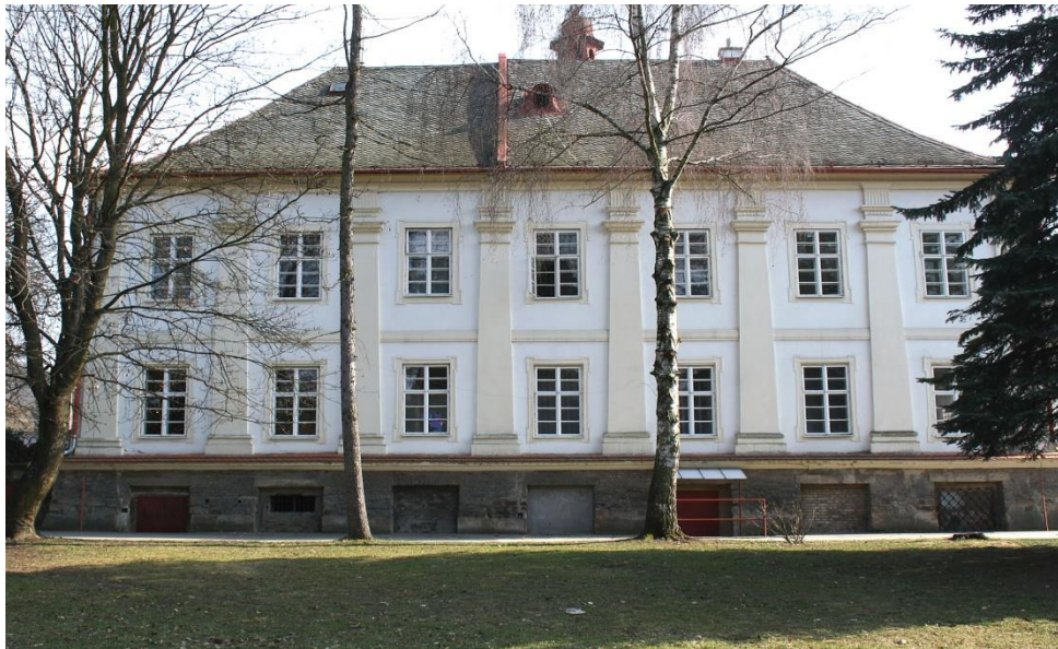
Zámek rodiny Serényiových, stavba z roku 1736.

V předchozích letech byla místní hudební škola jen detašovaným pracovištěm zlínské, v té době Lidové školy umění, a její začátky byly velmi skromné. Rozvíjela se od roku 1964. Samostatná ZUŠ byla zřízena až ve školním roce 1986/1987. V současné budově Masarykova 137 je hlavní sídlo ZUŠ, ředitelna a vedení školy, kancelář ekonomky a 13 učeben pro hudební obor.