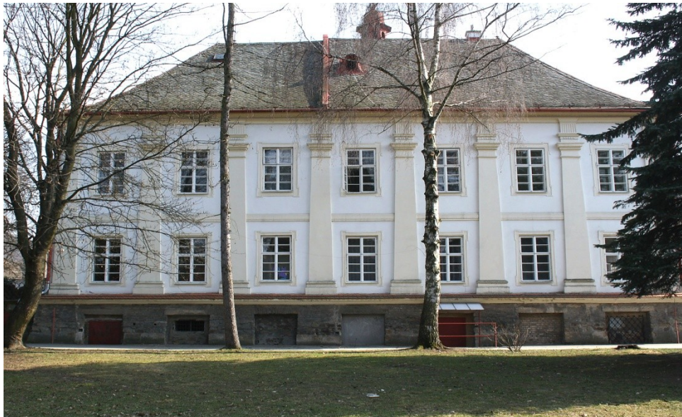
Zámek rodiny Serényiových, stavba z roku 1736.

ZUŠ Luhačovice sídlila do 31. 3. 2020 v památkově chráněné budově barokního zámku hrabat Serenyiů (1736). Od 1. 4. 2020 jsme našli nové zázemí za nových, příznivějších podmínek v centru města na ul. Masarykova č. 137, kde nyní sídlí hudební obor ve dvou patrech, taneční obor má své sídlo na internátě SOŠ Luhačovice, Masarykova 999 a výtvarný obor se přemístil do hlavní budovy SOŠ, Masarykova 101. Zámek Luhačovice se navrátil jejich původním majitelům, kteří projevíli zájem usadit se po vzoru svých předků opět v Luhačovicích a v zámku budou bydlet.