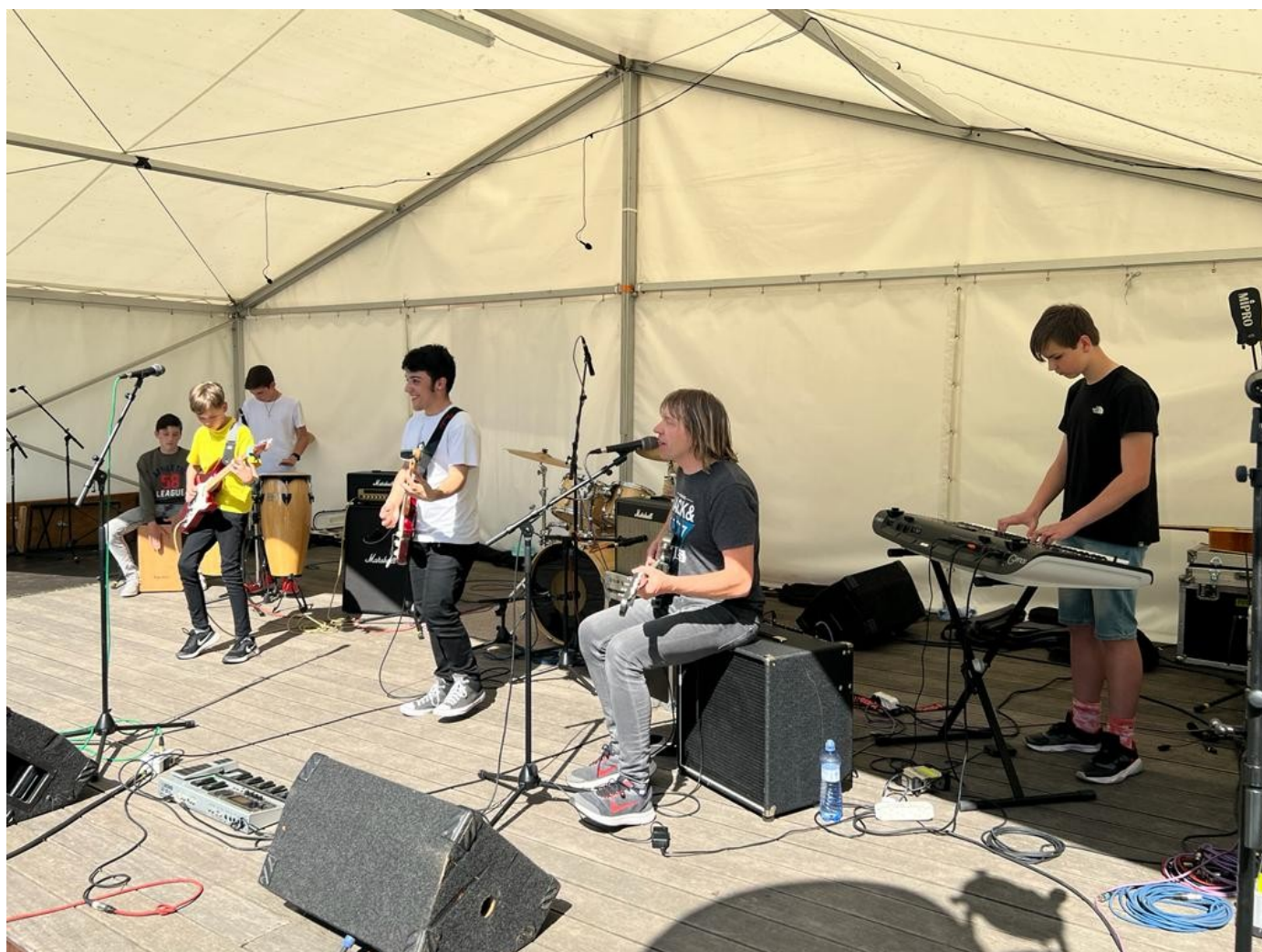
Vystoupení kapely na Zlínském Filmovém Festivalu 30. 5. 2022